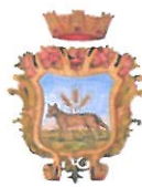
COMUNE DI VILLARICCA (Città Metropolitana di Napoli)